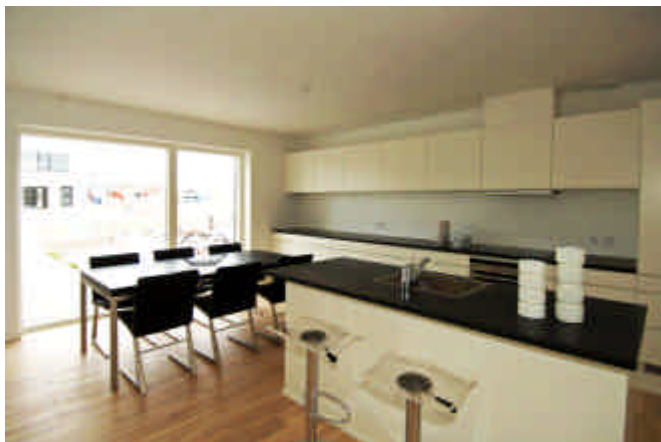
Dejlig lyst køkken/alrum