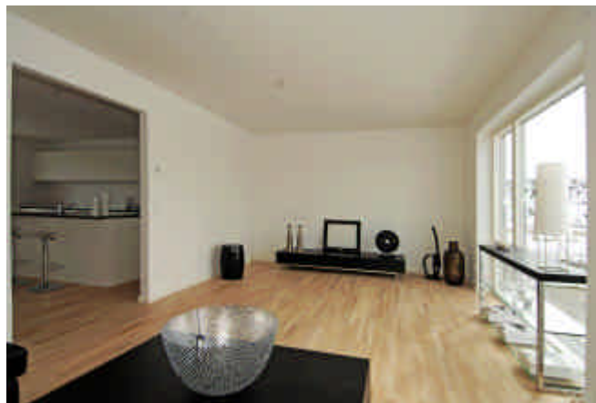
Stue med stort glasparti